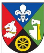
Obec Záběštní Lhota